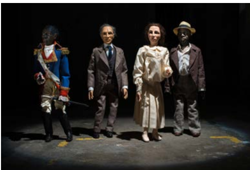
PETER FRIEDL The Dramatist , 2013