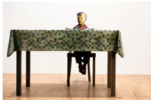
MARTIN HONERT Foto (Klein-Martin am Tisch) , 1993