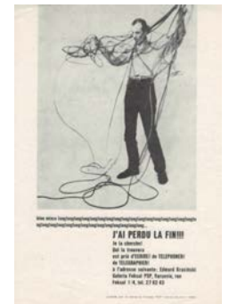
EDWARD KRASINSKI J'ai perdu la fin !!! , 1969