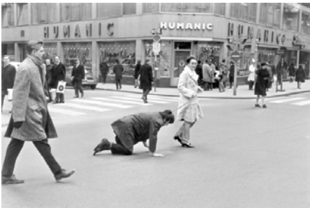
VALIE EXPORT & PETER WEIBEL Aus der Mappe der Hundigkeit , 1968