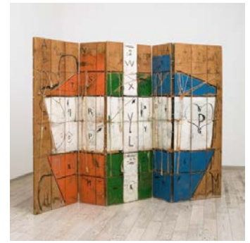
ETIENNE-MARTIN Paravent , 1965