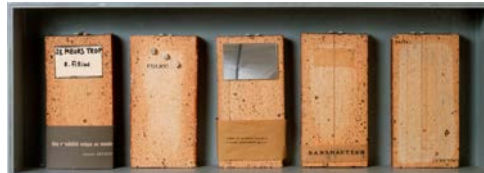
ROBERT FILLIOU Autobiographical , 1963-1973