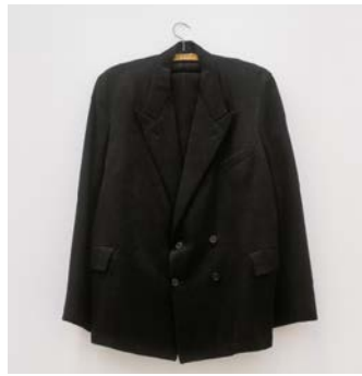
MARCEL BROODTHAERS Le Costume d'Igitur , 1969